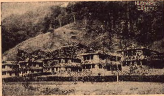
HOSPITAL DE GOLFITO

¡Bella Margarita: qué infortunada fuiste! FIN