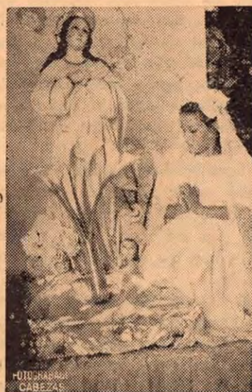
Su Primera Comunión.

grupo de estimables como encantadoras señoritas del lugar. Se le puso el nombre de La Divina Pastora, y su colaboración en todos los actos religiosos del lugar es digna de felicitación.