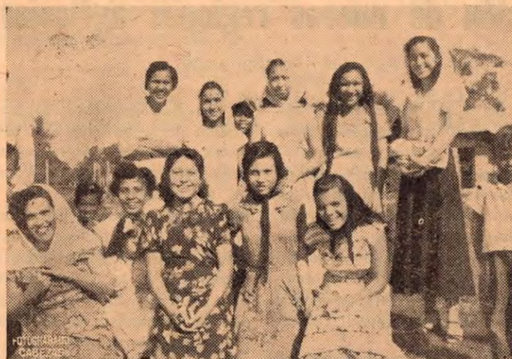
Grupo del Coro de la Divina Pastora.

En Puerto Cortés, de la zona bananera, se fundó hace algún tiempo un coro, integrado por un