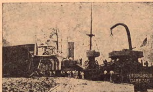
Un barco bananero cargado de fruta en Golfito.